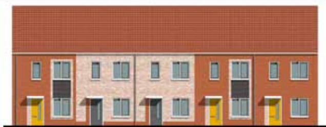
TYPE RODE EN LICHT STEEN