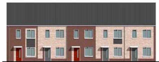
TYPE DONKERE EN LICHTE STEEN

De woningen worden aangesloten op het warmtenet van HVC en worden voorzien van hoogwaardige isolatie en HR++- glas wat zorgt voor een hoog wooncomfort en betaalbare energielasten. De netto huur is € 678,- per maand en de servicekosten zijn € 6,25 per maand.